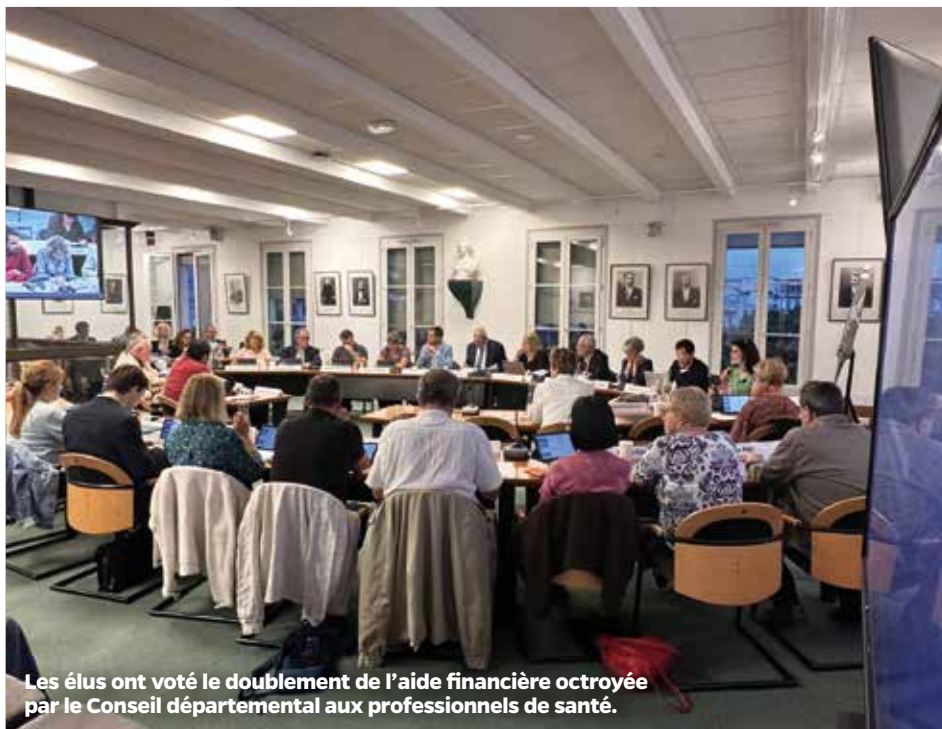
Les élus ont voté le doublement de l'aide financière octroyée par le Conseil départemental aux professionnels de santé.

Afin de favoriser le maintien et l'installation de professionnels de santé à Viry-Chatillon, les élus ont voté le doublement d'une prime départementale par une aide communale.