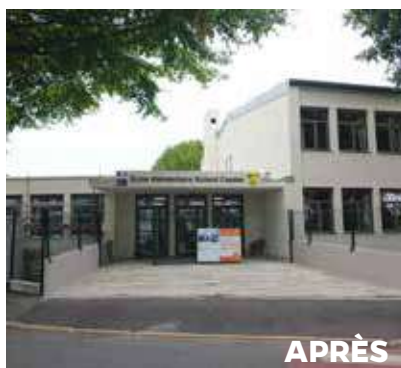
Travaux d'isolation à l'école Cassier, été 2023.