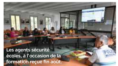
Les agents sécurité écoles, à l'occasion de la formation reçue fin août.

Rattachés à la Police municipale, ces agents sécurité écoles ont été formés à la fin du mois d'août avec, parmi eux, deux nouvelles recrues. Postés devant les écoles ou les groupes scolaires, priorisés en fonction de la circulation et de la dangerosité environnante, ces agents assurent la sécurité des écoliers en facilitant la traversée des passages piétons et en rappelant également les consignes de sécurité notamment aux automobilistes, de 8h15 à 8h45 et de 11h15 à